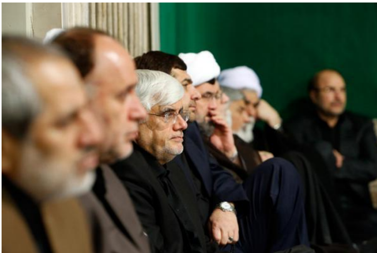
حضور در مراسم عزاداری حسینیه امام خمینی (ره)